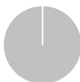
Alignement des investissements sur la taxinomie, hors obligations souveraines*

■ Alignés sur la taxinomie (hors gaz et nucléaire) (0%) ■ Non alignés sur la taxinomie (100%)